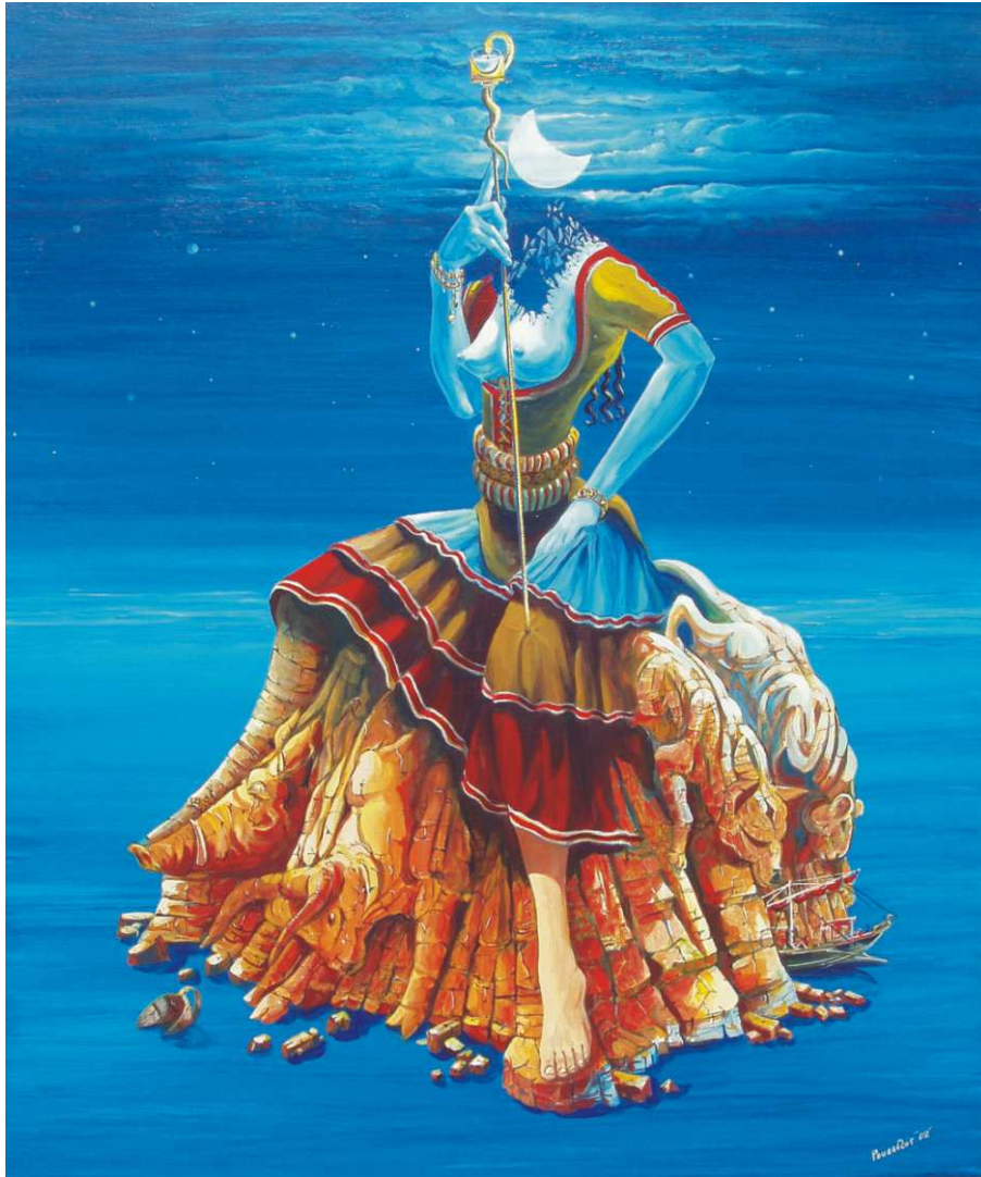
Πίνακας του Ρουσσέτου Παναγιωτάκη

Το Αρχαίο Αίδο Ποδισμικό Μνημείο των Λευκών Ορέων της Κρήτης, από το Αρχαίο Παράδεισο