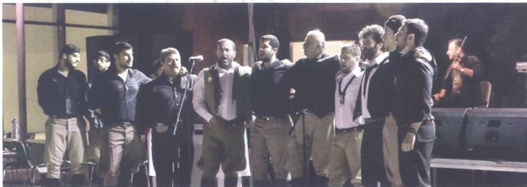
Ανοιγμα του γλεντιού με την ομάδα ριζιτικων του συλλόγου μας

Σε μία ιστορική, φιλοσοφική και ποιητική προσέγγιση, λοιπόν, συνοδευόμενη σαφέστατα με πολύ τραγούδι, τα ενδιαφερόμενα μέλη του συλλόγου κάθε Κυριακή συναντιούνται για να εντρυφήσουν στο ριζίτικο, να μάθουν τους ρυθμούς των τραγουδιών, να τα τραγουδήσουν ένας ένας αλλά και όλοι μαζί ως χορωδία, να μάθουν ιστορικά στοιχεία για την προέλευση του κάθε ενός τραγουδιού και να τοποθετηθούν ελεύθερα ως προς το τι συμβολίζει το κάθε τραγούδι για εκείνους, πως τους επηρεάζει προσωπικά και να βιώσουν την επιτομή της συντροφικότητας που κρύβεται στο χαρακτηριστικό κυκλικό πιάσιμο των τραγουδιστών.