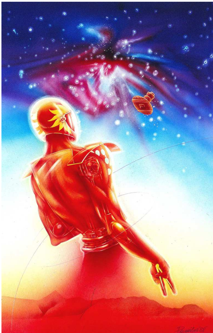
Πίνακας του Ρουσσέτου Παναγιωτάκη