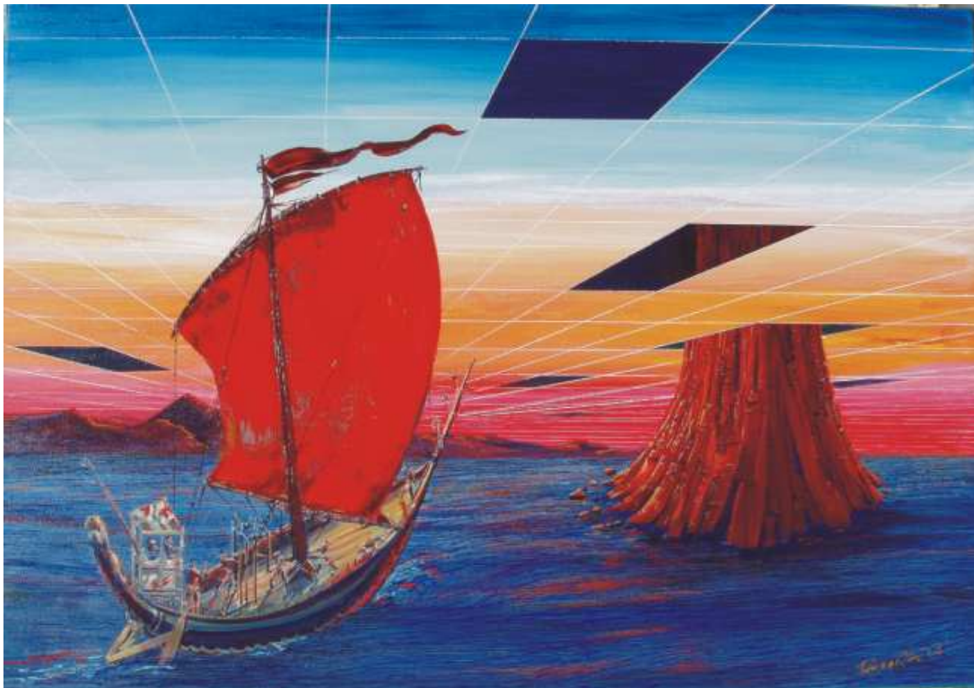
Πίνακας του Ρουσσέτου Παναγιωτάκη