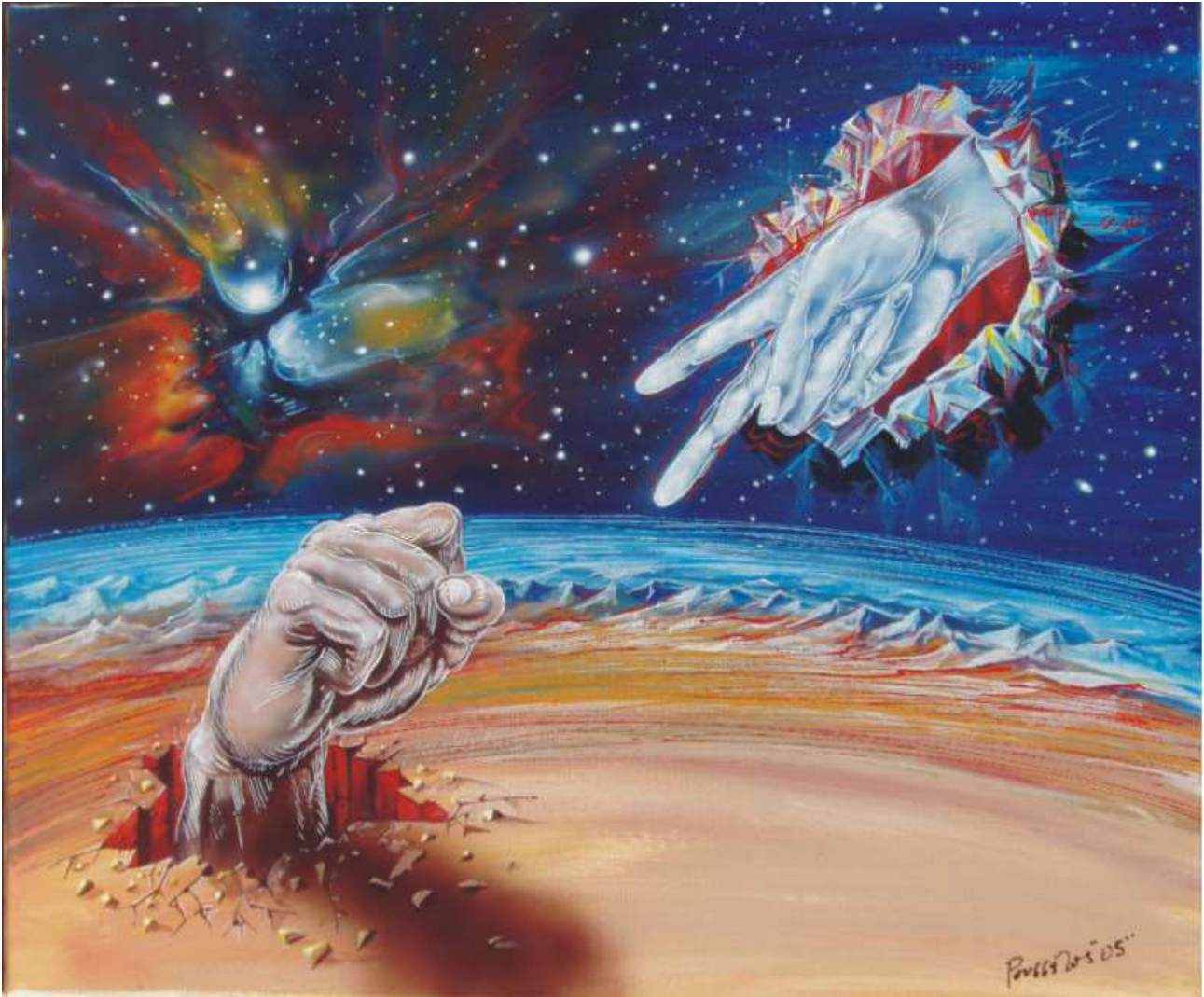
Πίνακας του Ρουσσέτου Παναγιωτάκη