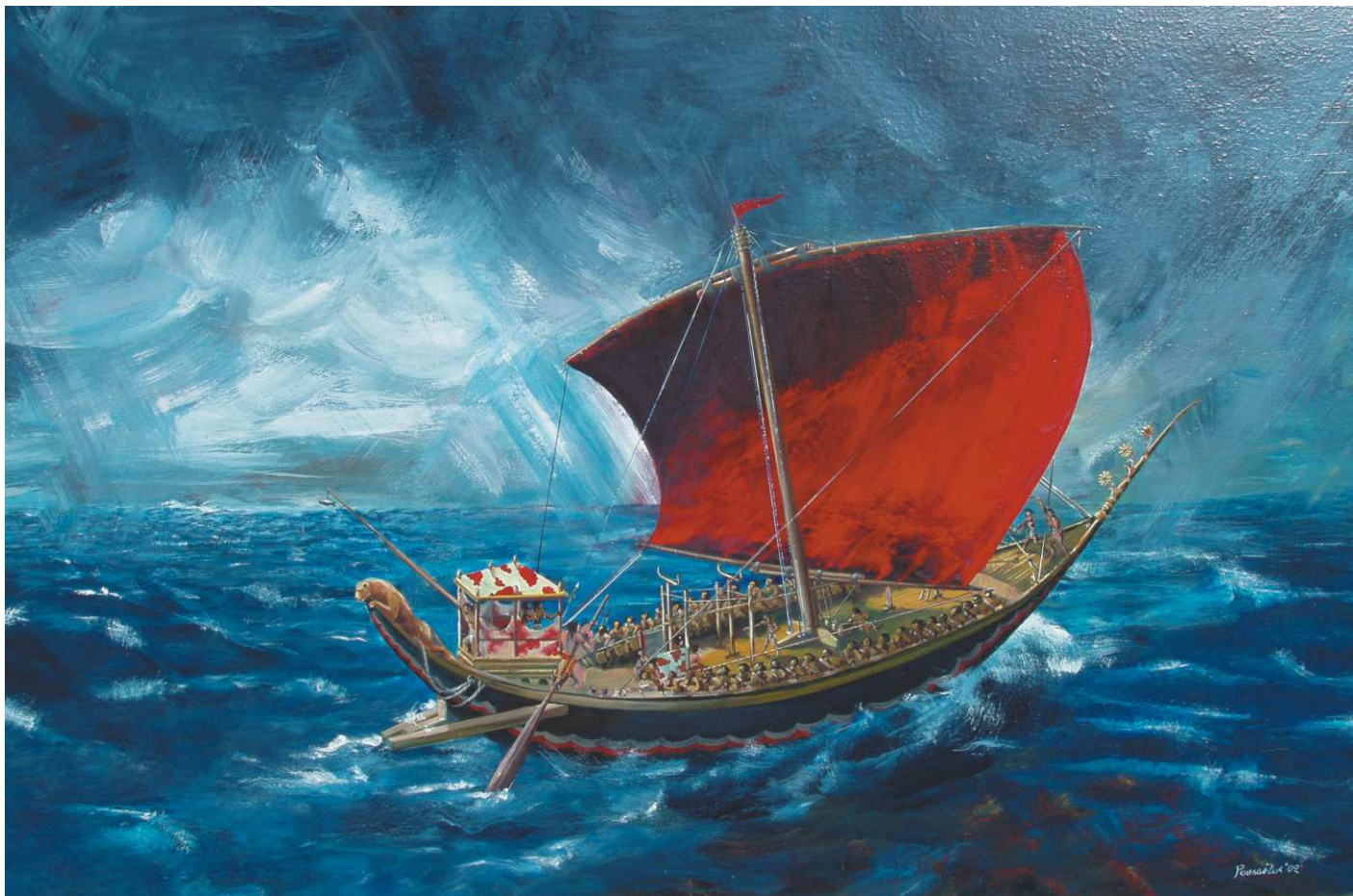
Πίνακας του Ρουσσέτου Παναγιωτάκη