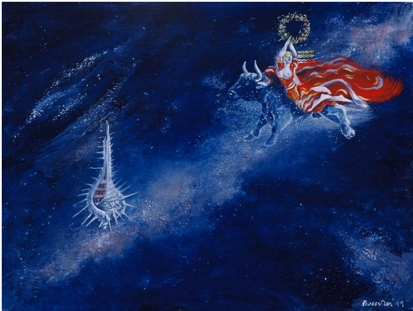
Πίνακας του Ρουσσέτου Παναγιωτάκη